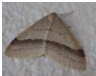
イチモジフユナミシャク (1/9)