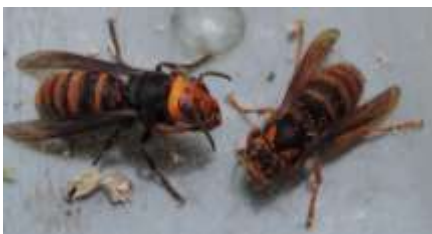
越冬女王 スズメバチ (1/25) コガタスズメバチ キロスズメバチ の女王