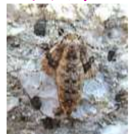
ナミスジフユシャク (1/20)