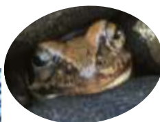
↑ニホンアカガエル (2/1)