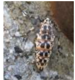
チャバネフユエダシャク (1/5)