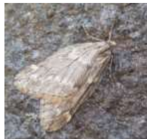
シロオビフユシャク (1/20)